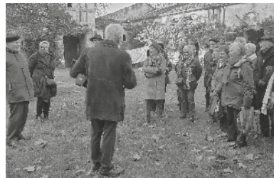
Dans la cour du château de Goulens à Layrac

En 2013, notre association a apporté son soutien au musée en offrant la restauration de trois sculptures : deux terres cuites du 18 e s. et un marbre du 15 e s. puis en 2014 en offrant la restauration d'une fontaine et son bassin - Faïence de Montauban ou Sud-Ouest, de la fin du 18 e s. , en 2015 et 2016 en offrant la rénovation des tissus d'un mobilier d'époque Restauration, en 2017, en participant à l'acquisition d'une nature morte de J.-B. Oudry (1712-1713) et du portrait-étude du Duc d'Orléans par J.-D. Court (1840-1844).