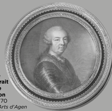
Tabatière avec le portrait du duc de La Vauguyon Vers 1765-1770