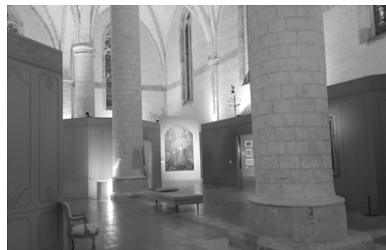
Les Jacobins - Vue de l'espace d'exposition

Sortie demi-journée suivant actualité des expositions ou conférence