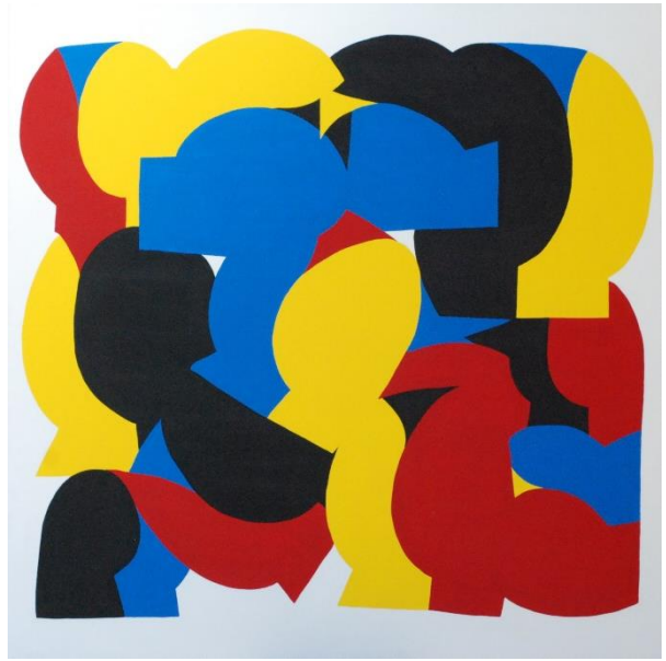
GOSSE, Blason , 2022, Acrylique sur toile, 150 x 150 cm, ©GOSSE