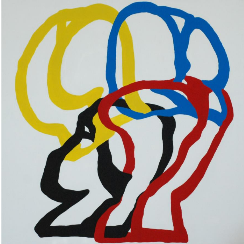
GOSSE, Liquide , 2022, Acrylique sur toile, 150 x 150 cm, ©GOSSE