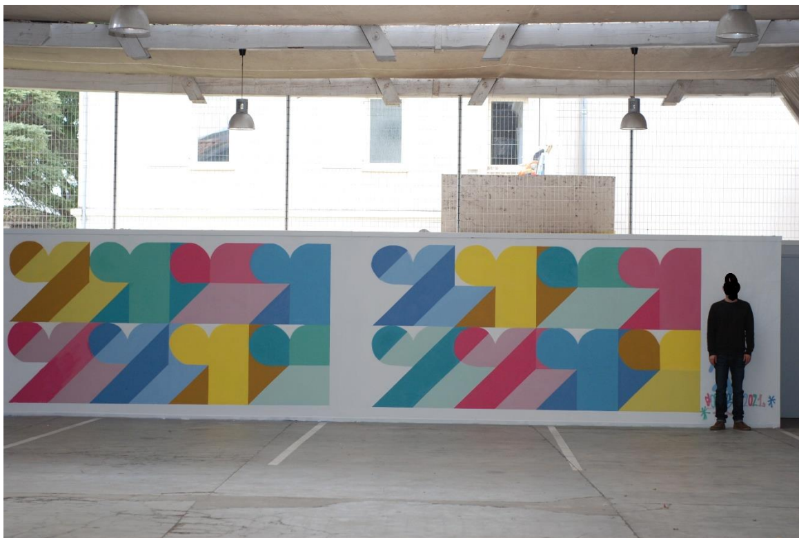
GOSSE, Stairway to heaven , 2021, Aérosol sur mur, 1500 x 200 cm, ©GOSSE

10-18 ans / Tarif : 6 € ; action famille 1 parent + 1 enfant : 8 €