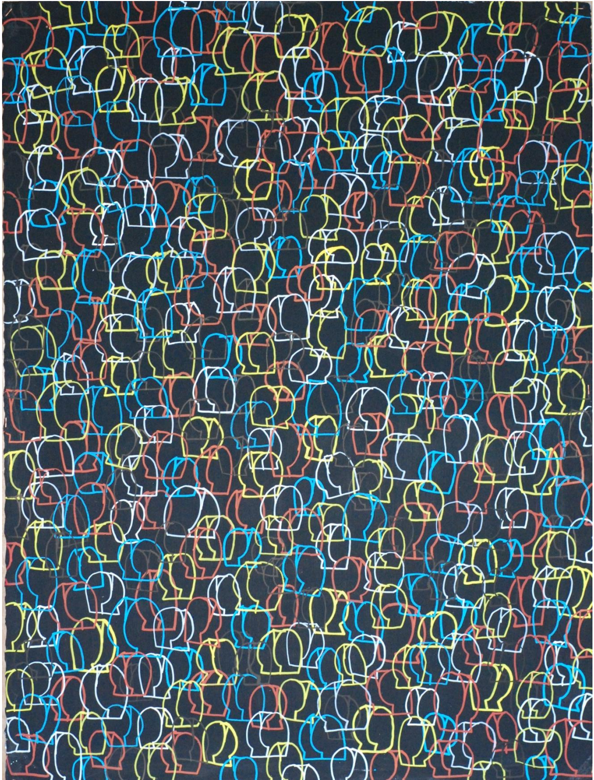
GOSSE, Illusion , 2022, Acrylique sur papier, 60 x 80 cm, ©GOSSE