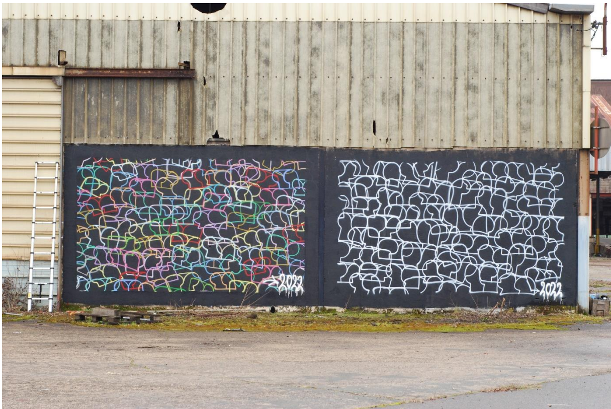
GOSSE, Into the wild , 2022, Aérosol sur mur, 1500 x 300 cm, ©GOSSE