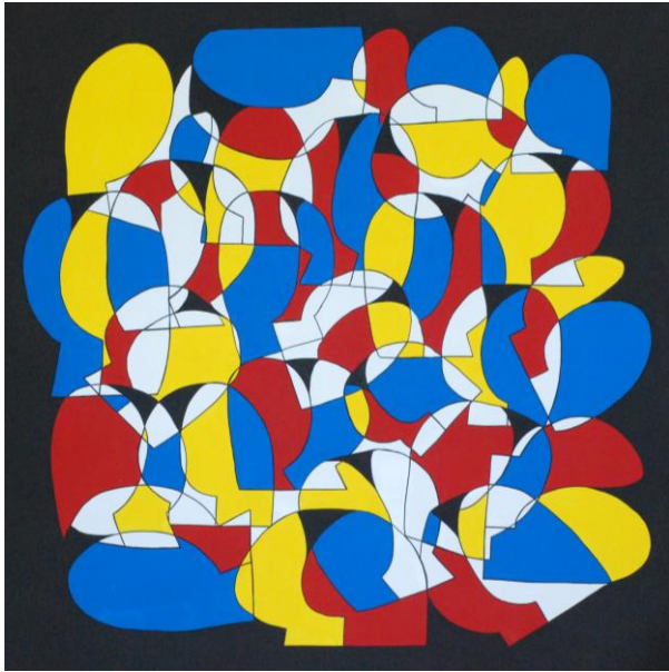
GOSSE, Into the wild , 2022, Acrylique sur toile, 150 x 150 cm, ©GOSSE