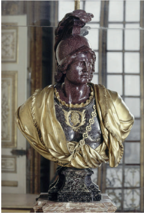
François Girardon, Buste d'Alexandre, MR 2204 ; MV 8613 ; N 15978, Musée national des châteaux de Versailles et de Trianon