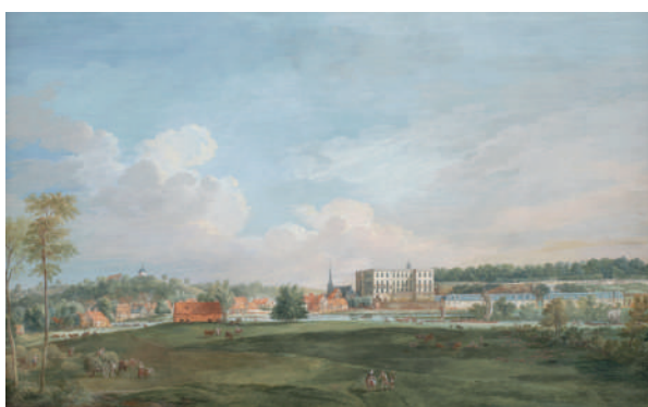
Henri-Joseph van Blarenberghe, Vue du château de Vézetz côté champs, gouache sur vélin, musée des Beaux-Arts d'Agen inv. 23 Ai

"Personnalité majeure de la cour de Versailles sous le règne de Louis XV, le duc d'Aiguillon, exilé sur sa terre d'Aiguillon en 1775, est à l'origine de l'accélération de ce renouveau".