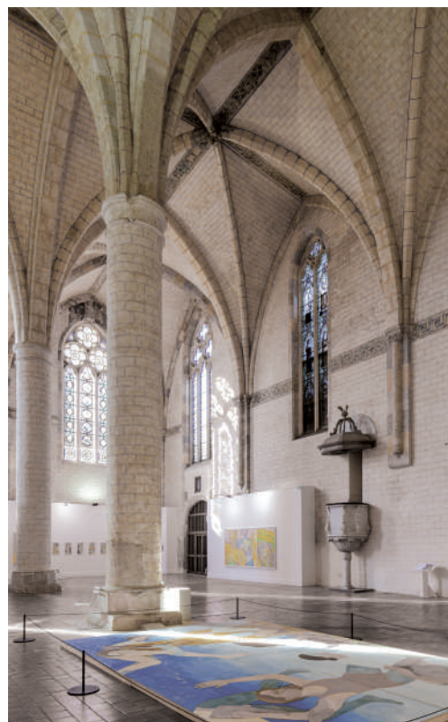
Église des Jacobins