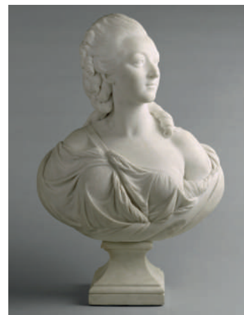
Augustin Pajou, Buste de Jeanne Du Barry, MR 2651 ; N 15483, Musée du Louvre