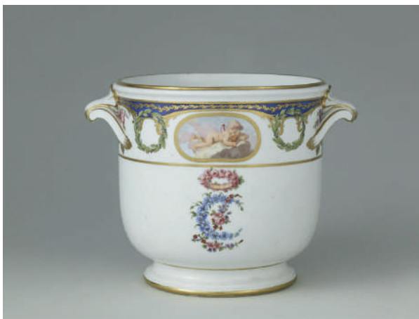
Seau à demi-bouteille du service offert en 1773, par Louis XV à la reine Marie-Caroline de Naples, OA 10879, Musée du Louvre