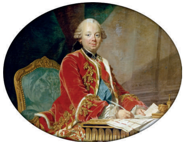
Louis-Michel van Loo, Portrait du duc Choiseul, MV 3845, Musée national des châteaux de Versailles et de Trianon