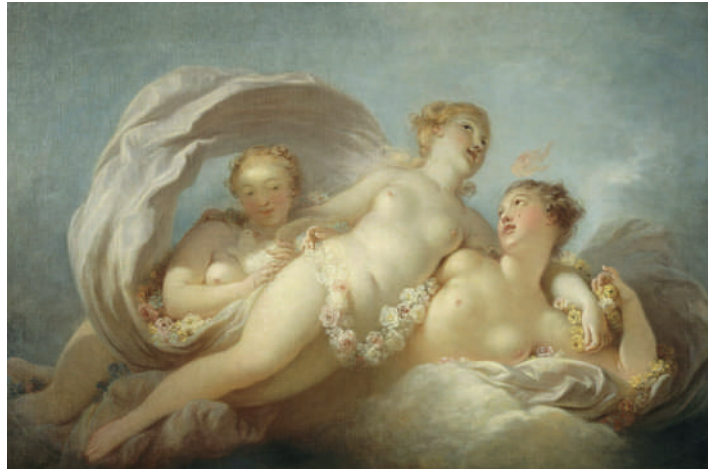
Jean-Honoré Fragonard, Les trois Grâces, 1700 / 1800, INV 5572 D 1958.1.1, dépôt du musée du Louvre, Villa-Musée Jean-Honoré Fragonard à Grasse