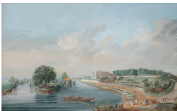
Henri-Joseph van Blarenberghe, Vue du château de Vézetz côté Cher, gouache sur vélin, musée des Beaux-Arts d'Agen, inv. 24 Ai

Le goût artistique du duc d'Aiguillon, qui procède d'une tradition familiale remontant aux cardinaux de Richelieu et Mazarin, s'inscrit dans une dynamique et une émulation, incarnées par le mécénat de Madame Du Barry et du duc de Choiseul. Ces personnalités de premier plan jouent un rôle dans le basculement vers une nouvelle esthétique, du goût "rocaille" au "style à la grecque", de François Boucher (1703-1770) et de Jean-Honoré Fragonard (1732-1806) à Joseph-Marie Vien (1716-1809).