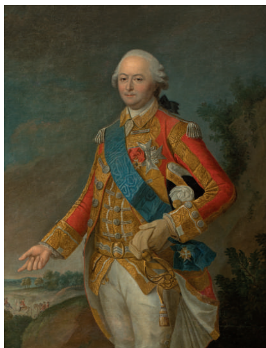
François-Hubert Drouais, Emmanuel-Armand de Vignerot, duc d'Aiguillon, vers 1774, huile sur toile, musée des Beaux-Arts d'Agen, inv. 2014.3.1

Agen et l'Agenais connurent au XVIII e siècle une période de prospérité économique et culturelle en marge du développement du port de Bordeaux. Une place importante sera donnée à l'exil agenais du duc d'Aiguillon, ministre des Affaires Étrangères du roi Louis XV et ami de Madame de Pompadour et de Madame du Barry, à l'origine de l'accélération de ce renouveau, et à sa collection de peintures conservée au musée, sera particulièrement mise en valeur dont l'œuvre majeure est incontestablement le portrait de Madame Du Barry en Flore peint par François-Hubert Drouais en 1773-1774, icône du portrait féminin du XVIII e siècle publiée dans toutes les biographies consacrées à la favorite. Des prêts prestigieux des grands musées français viendront compléter ce fonds.